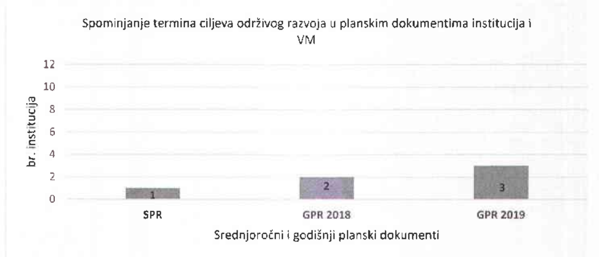
Dijagram 1. Broj institucija koje u planskim dokumentima spominju Ciljeve održivog razvoja

Dalje, Ured za reviziju je na uzorku institucija analizirao 32 da li institucije u srednjoročnim programima rada (SPR) i godišnjim programima rada (GPR) za 2018. i 2019. godinu pominju termine "ciljevi održivog razvoja" ili "Agenda 2030". Rezultati su prikazani u dijagramu.