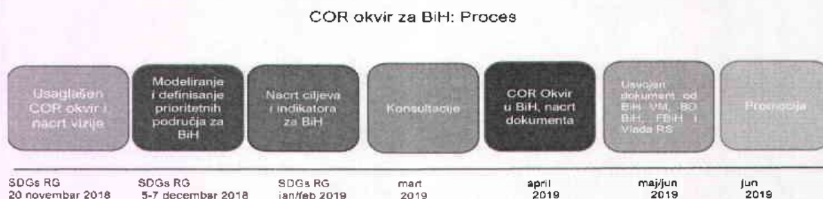
Slika 2. Pregled aktivnosti na izradi Okvira Ciljeva održivog razvoja

Ova radna podgrupa održala je prvi sastanak krajem oktobra 2018. godine i od tada se sastajala nekoliko puta u cilju definisanja sadržaja dokumenta. Vremenski rokovi koji su postavljeni za izradu ovog dokumenta mijenjani su, i predstavljeni su u nastavku u grafikonu.