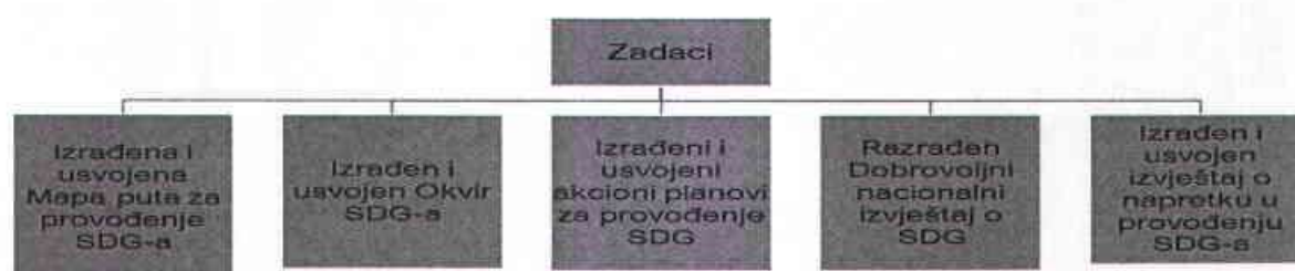
Grafikon 1. Zadaci Radne grupa za planiranje provođenja Ciljeva održivog razvoja u BiH