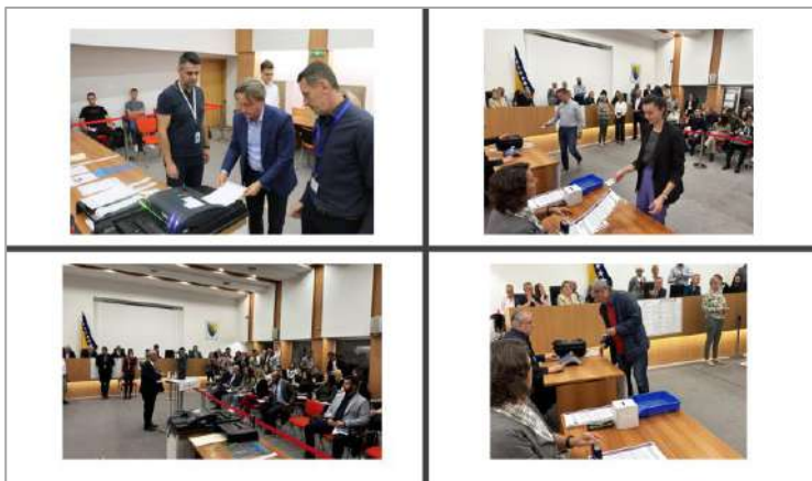
Dani otvorenih vrata „Promocija novih tehnologija u izbornom procesu“