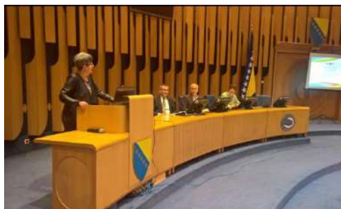
Stručna rasprava „Uloga nadležnih organa u izradi Centralnog biračkog spiska“

ministarstva raseljenih lica i izbjeglica, Ministarstva za izbjeglice i raseljena lica RS, te predstavnici pojedinih matičnih ureda.