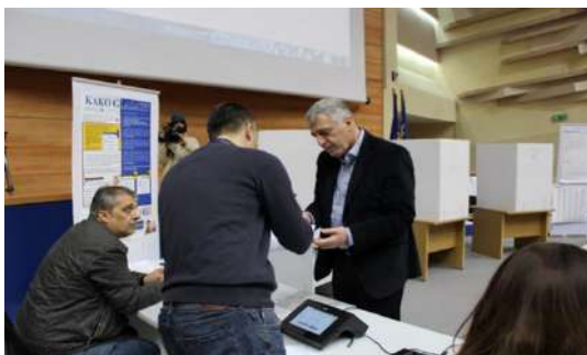
Simulirani izbori uz korištenje e-pen (elektronske olovke)