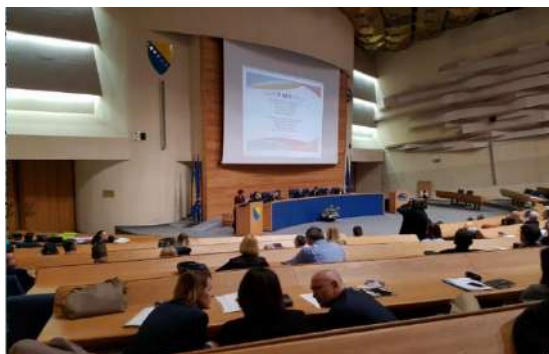
Okrugli stol o vrsti, načinu i tempu uvođenja novih tehnologija u izborni proces u Bosni i Hercegovini, Sarajevo, 15. 3. 2017.