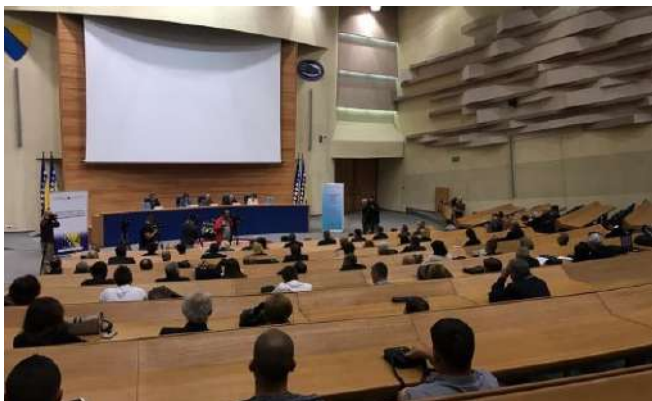
Promocija publikacije „Nove tehnologije u izbornom procesu – izazovi i mogućnosti primjene u Bosni i Hercegovini“