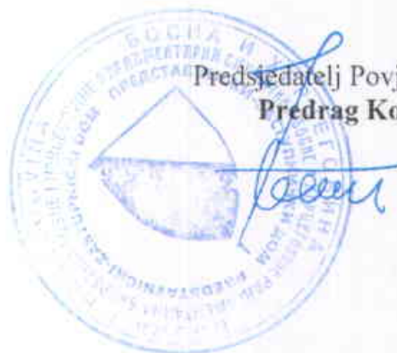
Predsjedatelj Povjerenstva Predrag Kožul

Na temelju članka 122. Poslovnika, Povjerenstvo je za izvjestitelja na sjednici Doma odredilo Predraga Kožula, predsjedatelja Povjerenstva.